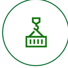
Todo Riesgo Construcción